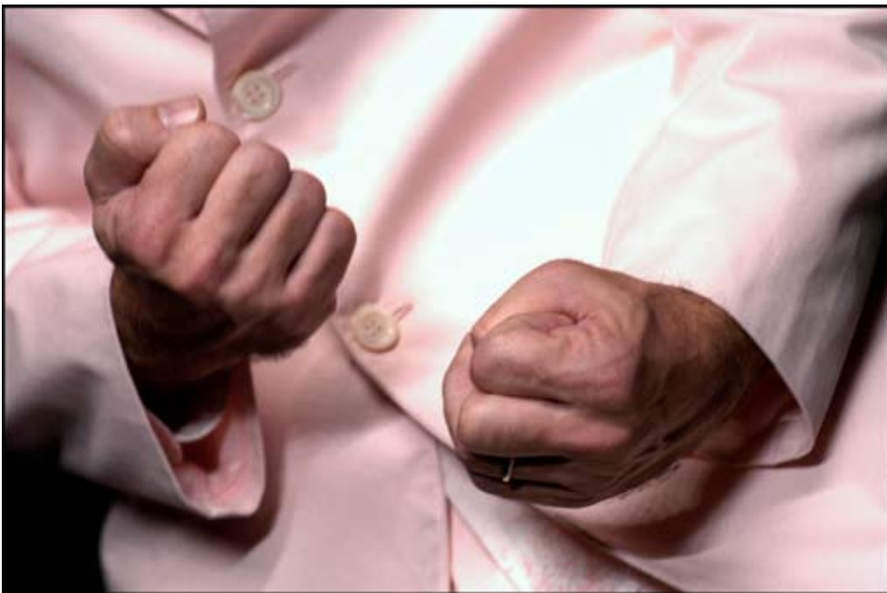
Élucidation, Onyx/Saint Herblain décembre 2010