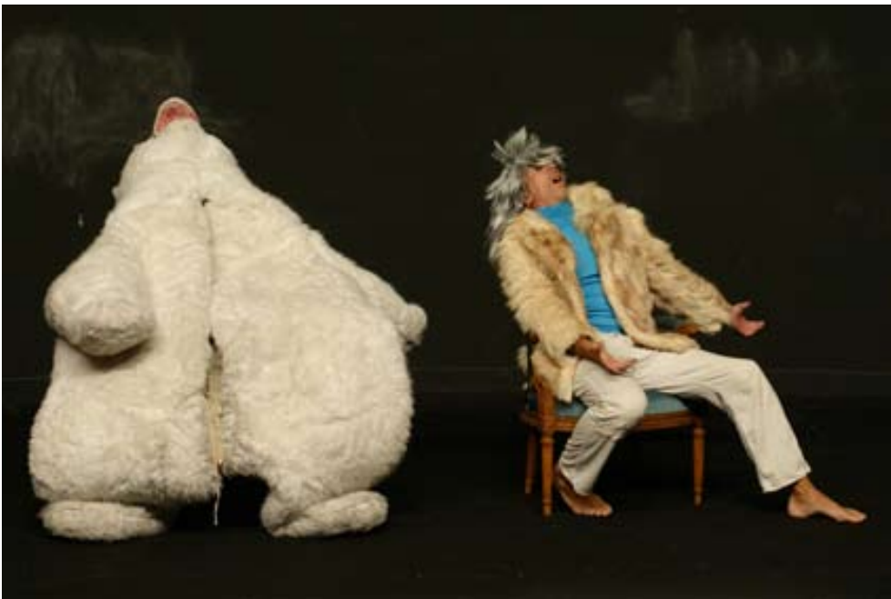
Morceau, TNB/Rennes novembre 2001