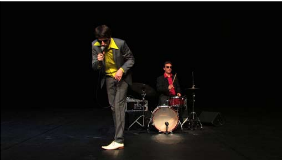
Un saut désordonné avec les épaules à la même hauteur que les hanches Aire Libre/Rennes, 2010