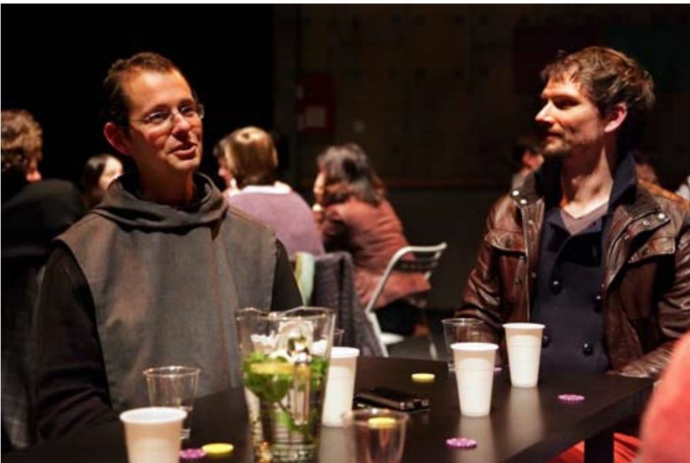
Autour de la Table Berlin août 2011 et Nantes janvier 2012 couverture: Nantes janvier 2012