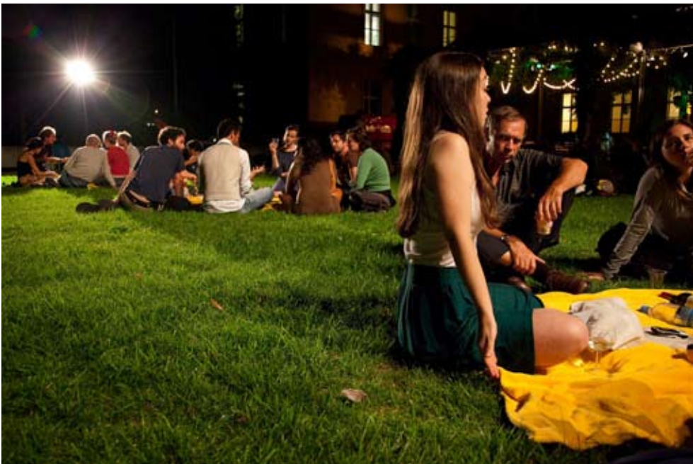
Autour de la Table Nantes janvier 2012 et Berlin août 2011