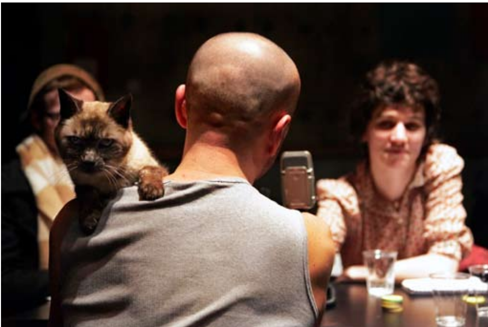
Autour de la table Istanbul octobre 2011 et Nantes janvier 2012